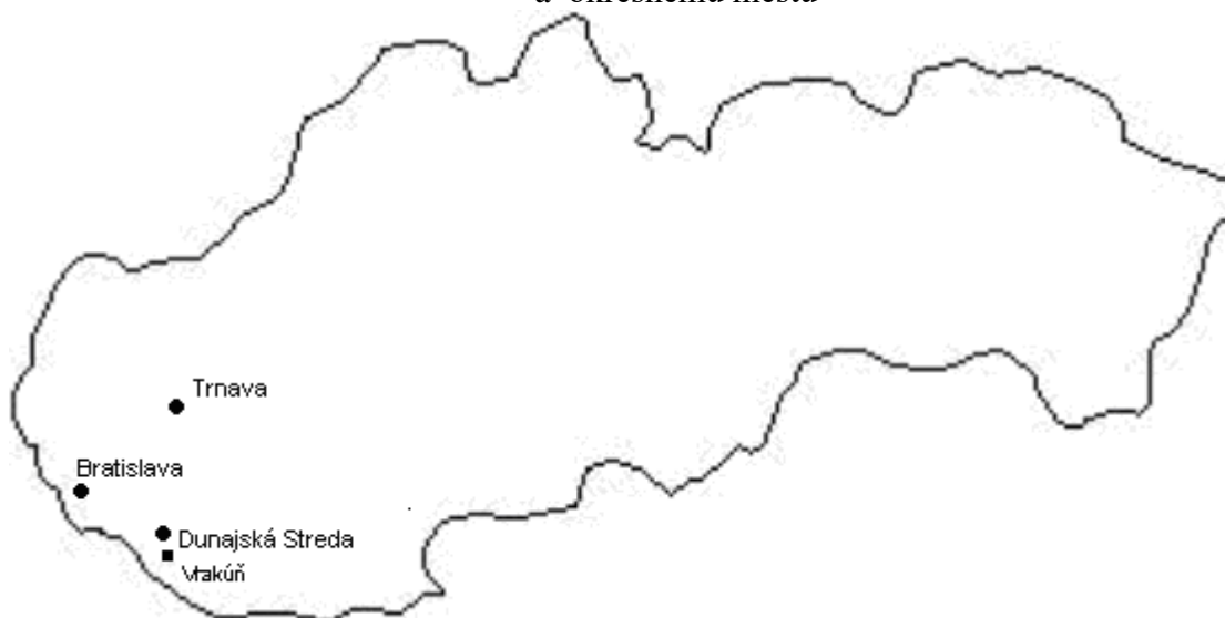
Mapa 1: Poloha obce Vrakúň na Slovensku vo vzťahu k hlavnému mestu, krajskému centru a okresnému mestu